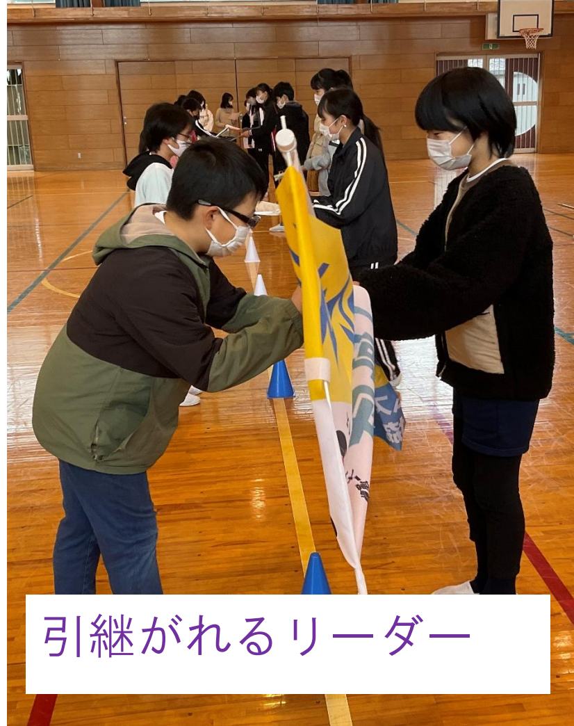
引継がれるリーダー

6年生から5年生へのリー ダー引継ぎ式と、4・5年 生の学校づくりの会から、 ●改めて6年生のすごさ ●それを見てきた5年生の たのもし成長 ●新たに高学年となる4年 生の意欲と育ち を感じました。 ありがとう。