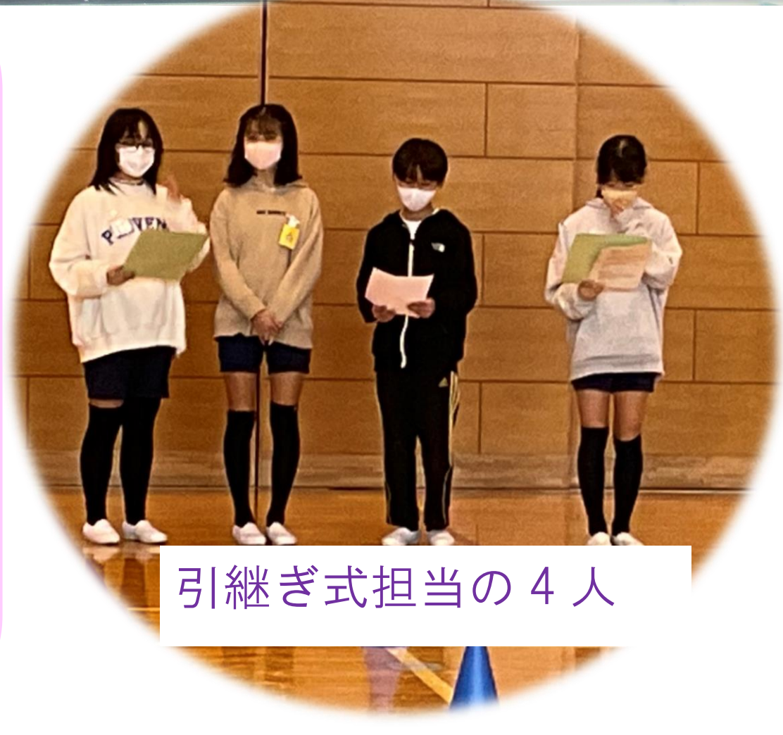
引継ぎ式担当の4人