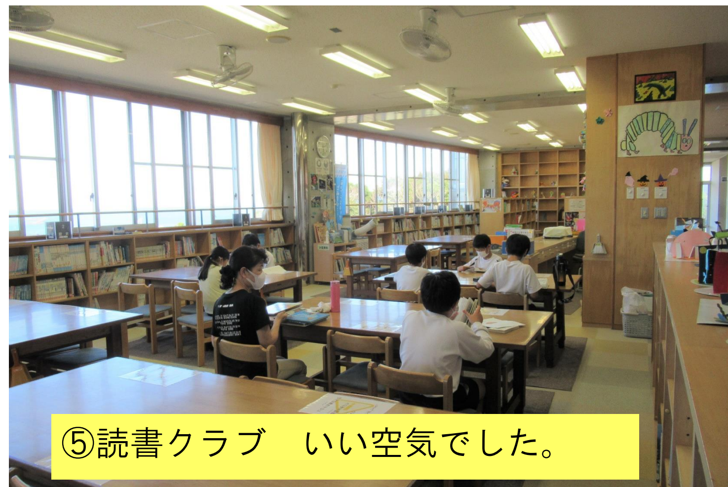
⑤読書クラブ いい空気でした。