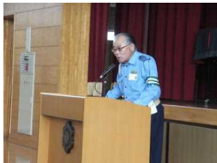
指導員さんのお話

交通指導員さんやPTA育成部の皆さんに参加していただき、交通安全について話し合いを行いました。交通事故ゼロの記録をさらに伸ばしてほしいです。