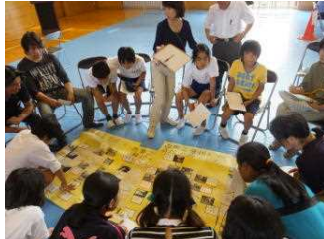
地区ごとの話し合い

交通指導員さんやPTA育成部の皆さんに参加していただき、交通安全について話し合いを行いました。交通事故ゼロの記録をさらに伸ばしてほしいです。